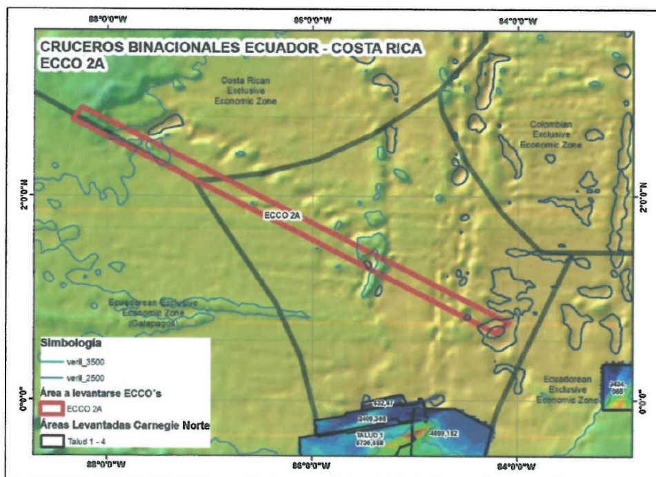
Figura 2: Área de navegación para el crucero binacional Costa Rica-Ecuador-ECCO 2017 02 A.